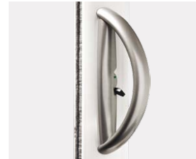
Poignée de tirage confort