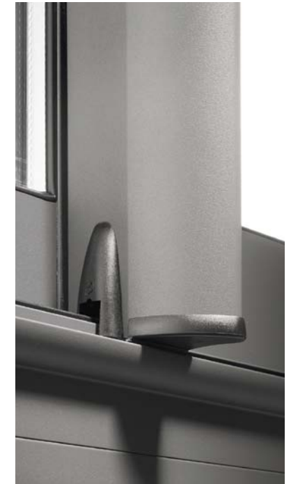
Finition basse pour renfort d'ouvrant