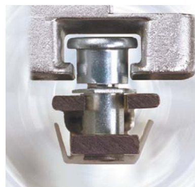
Galet à tête champignon