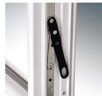
Verrouillage du semi-fixe par crémone