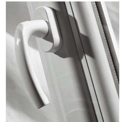
Poignée centrée sur châssis deux ouvrants