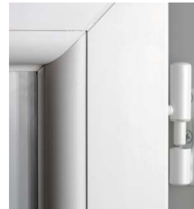
Paumelles à vis cachées et bagues téflon