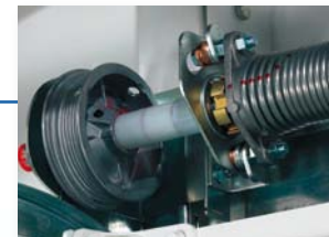
Système d'équilibrage par répartiteurs à torsion.