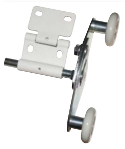
Verrouillage moteur autobloquant Galets de blocage (8 minimum).