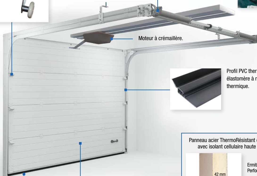
Moteur à crémaillère.