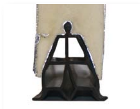
Joint de compression en partie basse du panneau...