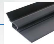
Profil PVC thermoplastique élastomère à rupture de pont thermique.