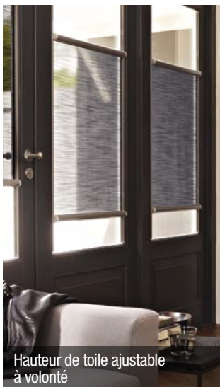
Hauteur de toile ajustable à volonté

Sur la base d'un store enrouleur, tissu groupe B, manœuvre par chaînette, L 1,20 x H 1,50 m. Pour bénéficier d'une TVA réduite à 10 % voir conditions en page 19.