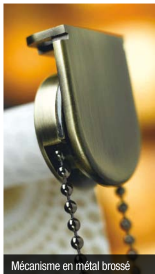
Mécanisme en métal brossé