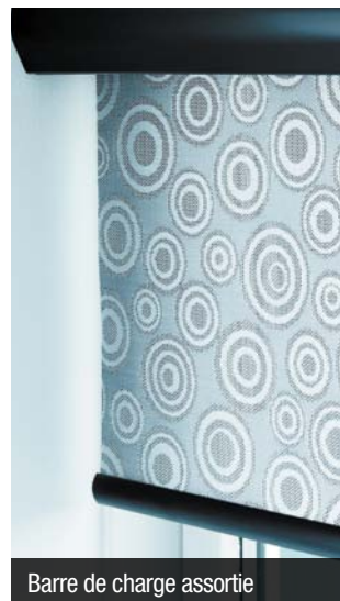
Barre de charge assortie